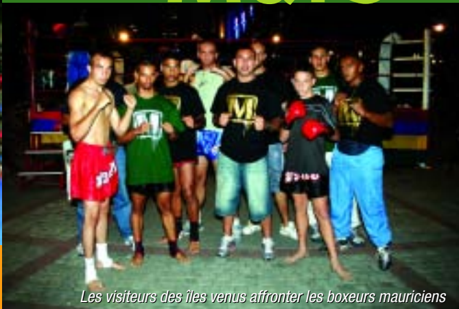
Les visiteurs des îles venus affronter les boxeurs mauriciens

Pour la première fois, un ring trônait en plein milieu de la place du Caudan. C'était pour un gala de kick-boxing le 31 mars. Ce plateau, étoffé avec de talentueux combattants dans les différentes catégories (Senior, Junior, Cadet et Poussin) a obtenu un tel succès que la Fédération mauricienne de kick-boxing a récidivé le samedi 5 mai avec une rencontre réunissant des participants des îles de l'océan Indien, pour le « Tournoi International de Port-Louis » au Caudan.